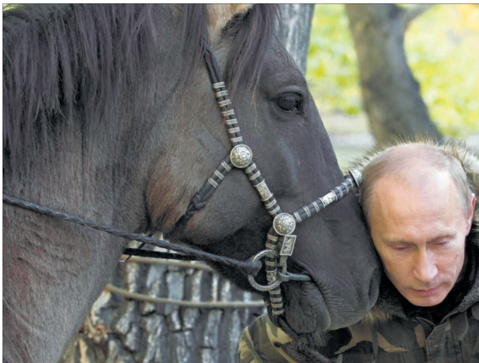
Zwei, die sich verstehen: Wladimir Putin hat ein Faible für starke Tiere.