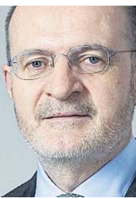
FDP-Präsident Fulvio Pelli.

Die Delegierten der SP Schweiz fordern eine Erbschaftssteuer für Reiche. Sie haben am Samstag an ihrer Versammlung in Olten SO beschlossen, die Volksinitiative «Millionen-Erbschaften besteuern für unsere AHV» zu lancieren. Die Initiative verlangt, dass Erbschaften in der Höhe von mehr als zwei Millionen Franken mit 20 Prozent besteuert werden, wie es in einer Mitteilung vom Samstag heisst. Zwei Drittel des Ertrages erhält der Ausgleichsfonds der AHV, ein Drittel verbleibt den Kantonen, welche die Steuer veranlassen und einziehen.